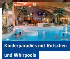
Kinderparadies mit Rutschen und Whirlpools