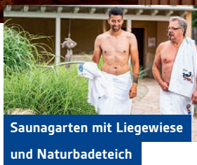
Saunagarten mit Liegewiese und Naturbadeteich