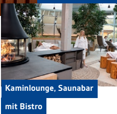
Kaminlounge, Saunabar mit Bistro